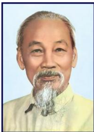
Chân dung Chủ tịch Hồ Chí Minh

Cảm nhận về tác phẩm “Những mẩu chuyện về đời hoạt động của Hồ Chủ tịch” – Trần Dân Tiên