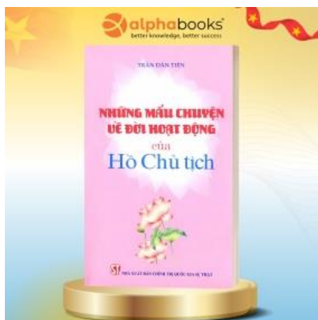
Bìa sách “Những mẩu chuyện về đời hoạt động của Hồ Chủ tịch” – bản hiện đại

Tác phẩm được viết bởi Trần Dân Tiên – mà sau này tôi mới biết chính là bút danh của Chủ tịch Hồ Chí Minh. Điều ấy khiến từng câu chữ trong sách trở nên thiêng liêng hơn. Cuốn sách như một lời tự sự khiêm nhường, đầy chân thành của Bác – Người không hề kể công, không tôn vinh bản thân mà chỉ kể lại những câu chuyện, những con người, và những bài học trên hành trình tìm đường cứu nước.