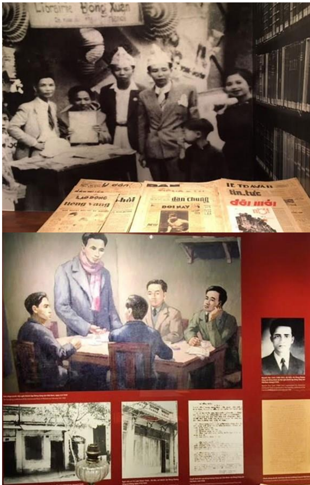
Hình 4. Hình ảnh trưng bày tại triển lãm “Ánh sáng từ Đường Kách mệnh”

Tôi tin, ngọn lửa ấy sẽ mãi cháy. Và tôi, sẽ mãi đi trong ánh sáng mà Người đã để lại – để tiếp tục hành trình làm người cách mệnh của thời đại hôm nay.