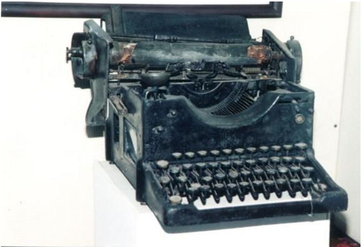
Hình 8. Máy chữ đồng chí Tô Hiệu, Lương Khánh Thiện đã sử dụng khi hoạt động cách mạng