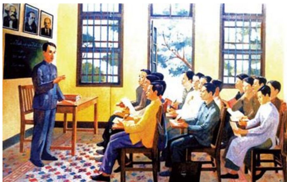
Hình 2. Nguyễn Ái Quốc và lớp huấn luyện chính trị cách mạng ở Quảng Châu (1926 – 1927)

Trong công tác chi bộ, tôi luôn cố gắng đổi mới phương thức lãnh đạo, phát huy dân chủ, tăng cường đối thoại, xây dựng không khí đoàn kết, gắn bó. Tác phẩm của Bác nhấn mạnh rằng người cán bộ phải đi đầu, phải gương mẫu, phải dẫn thân và hy sinh – điều đó nhắc tôi rằng vị trí Phó Bí thư không chỉ là danh hiệu, mà là một trách nhiệm, một niềm tin mà tổ chức giao phó. Tôi không cho phép mình được tự mãn hay ngừng học tập, mà luôn tìm cách hoàn thiện bản thân, mở rộng kiến thức, nâng cao trình độ và đặc biệt là giữ gìn đạo đức, phẩm chất trong sáng.